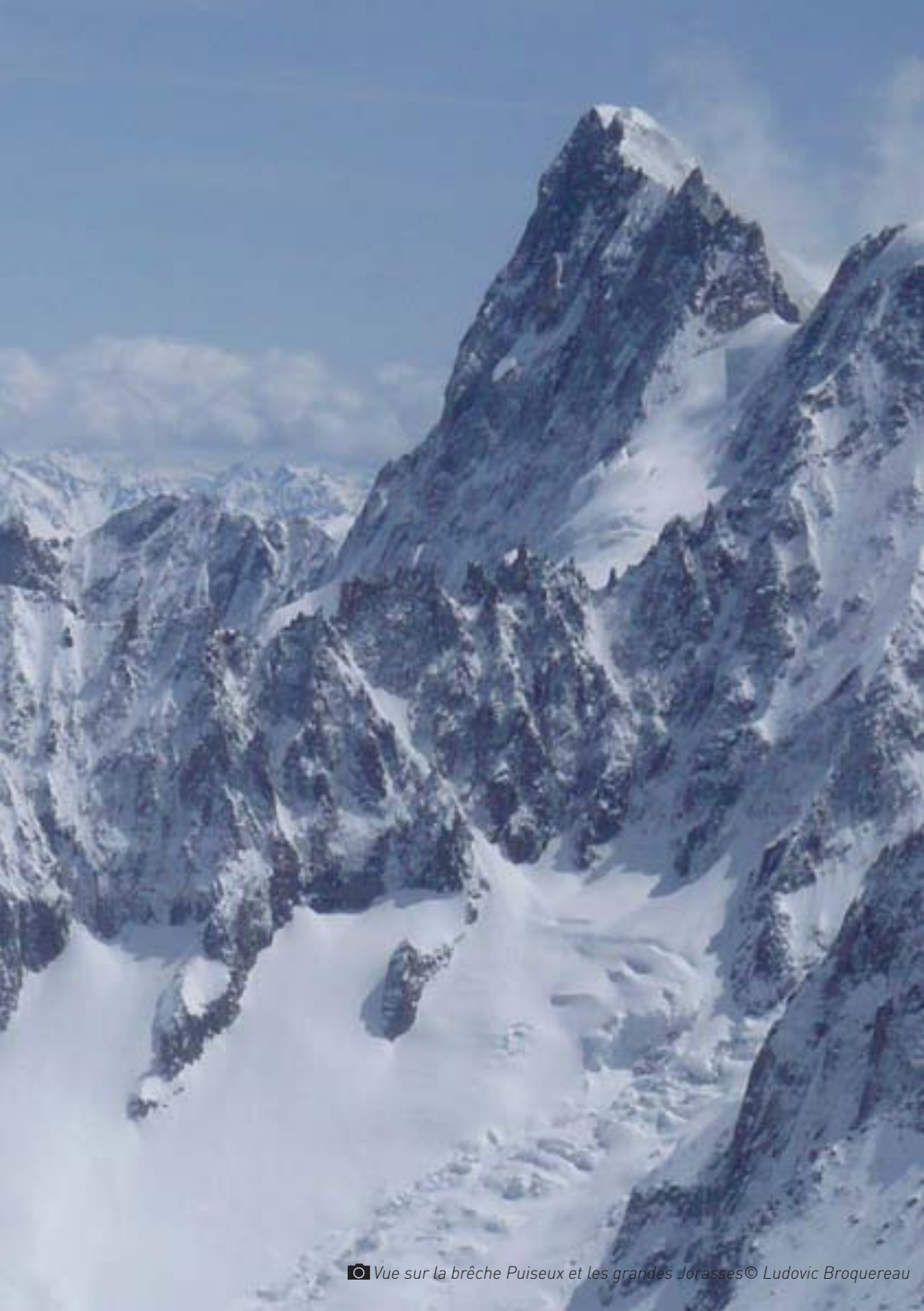
© Vue sur la brèche Puiseux et les grandes Jorasses © Ludovic Broquereau