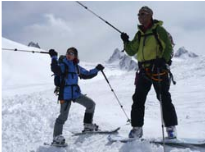
📷 Nos deux extra-terrestres

oublié: des quantités et conditions de neige digne d'un mois de février ! Tous les itinéraires sont tracés. Nous optons pour la vallée blanche classique, histoire de retrouver tranquillement les sensations et de ne pas faire de casse dès le premier jour. Evidemment, Hubert nous dotera de quelques belles cabrioles dont il a le secret. Après un parcours tranquille dans une neige profonde mais un peu lourde, nous arrivons vers 14h30 au refuge du Requin qui sera le terminus de ce jour (D-: 1300m). Gardiens et accueil sympas aux premiers abords mais qui ne souffriront pas la comparaison avec leurs collègues du Couvercle que nous rencontrerons